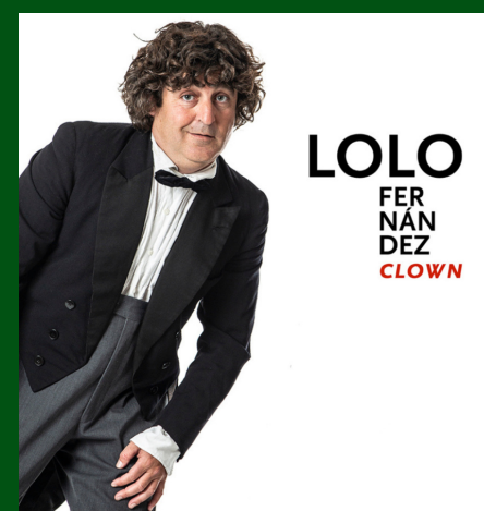
LOLO CLOWN CONCIERTO DIDÁCTICO