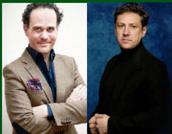
ILBOSCO DI GIANIANNI