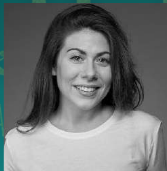
IRENE BARRIOS Rosalía