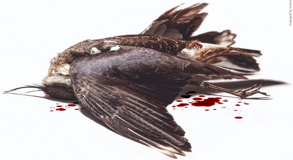
Diseño de cartel: Ricardo Sánchez-Cueca

Fernando Huesca Luís Bermejo Jacobó Dicenta