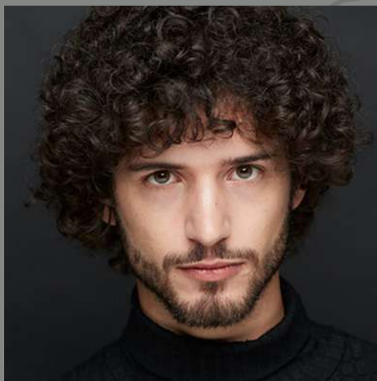
JUAN DE VERA